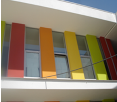
Utilização de folhas de papel como estores para proteger as crianças do sol.

- Verificou-se que muitas das luzes de emergência estão avariadas.