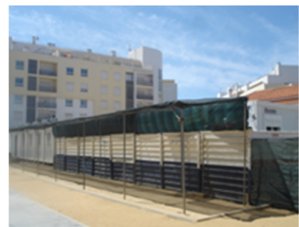
Contentores onde funciona o refeitório