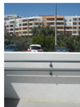
Vista do muro na rampa saída principal

Também gostaríamos de levar ao vosso conhecimento que de alguma forma estes assuntos chegaram á comunicação social, tendo esta associação sido contatada por alguns jornais nacionais na tentativa de saber qual a posição da associação sobre os problemas existentes na escola.