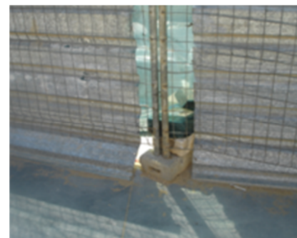
Folhas de alumínio cortantes como proteção nas vedações

- O refeitório funciona num contentor sem condições adequadas para o efeito, claramente sem capacidade para atender convenientemente toda a comunidade escolar. O sistema de ar condicionado nos contentores é insuficiente para manter um ambiente adequado durante as refeições, fomos informados que cerca de 50% dos aparelhos de ar condicionado existentes estão desligados, uns por avaria outros porque