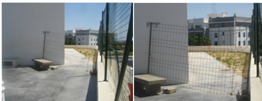
Barreiras proteção irregulares

É nossa intenção zelar pelo bem-estar de toda a comunidade escolar, em conjunto com o agrupamento e com a Câmara Municipal, e estamos ao dispor para colaborar no que estiver ao nosso alcance.