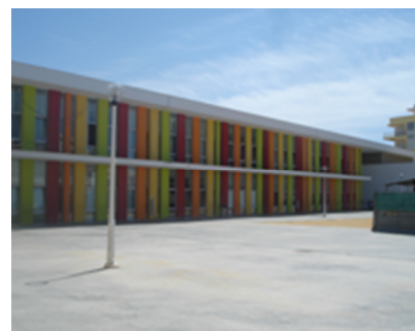
Aspeto geral recreio escola A Ausência de sombras