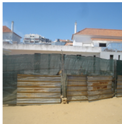
Aspetto das proteções existentes

- Verificou-se que a refeição (almoço) é transportada, entre as 11h 15m e as 11h 45m, do Centro comunitário do Alvor para a escola do Pontal, em veículos não equipados e autorizados para o transporte de alimentos confeccionados, em tachos e panelas na bagageira de um veículo ligeiro sem ventilação, e com acondicionamento impróprio.